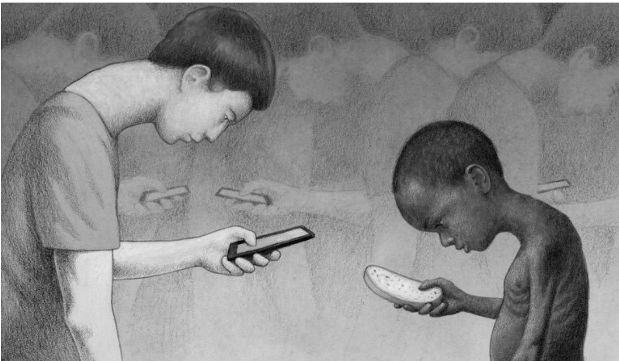
Ilustração: Pawel Kuczynski www.dmtmdebate.com.br , consultado em 23/10/2020